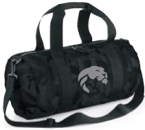
BORSONE TUBOLARE 35 euro