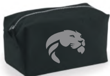
ASTUCCIO BLACK 16 euro