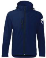
GIACCA UOMO/DONNA 65 euro