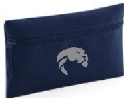
ASTUCCIO NAVY 9 euro