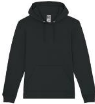
FELPA UOMO/DONNA 35 euro