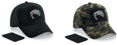
CAPPELLINO 18 euro