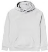
FELPA BAMBINO/BAMBINA 30 euro